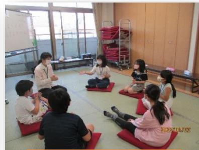
レッツエンジョイイングリッシュ