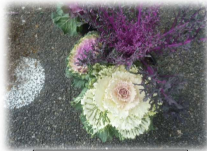
寄せ植え(葉ぼたん)