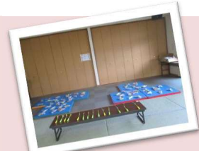
お楽しみゲームコーナー